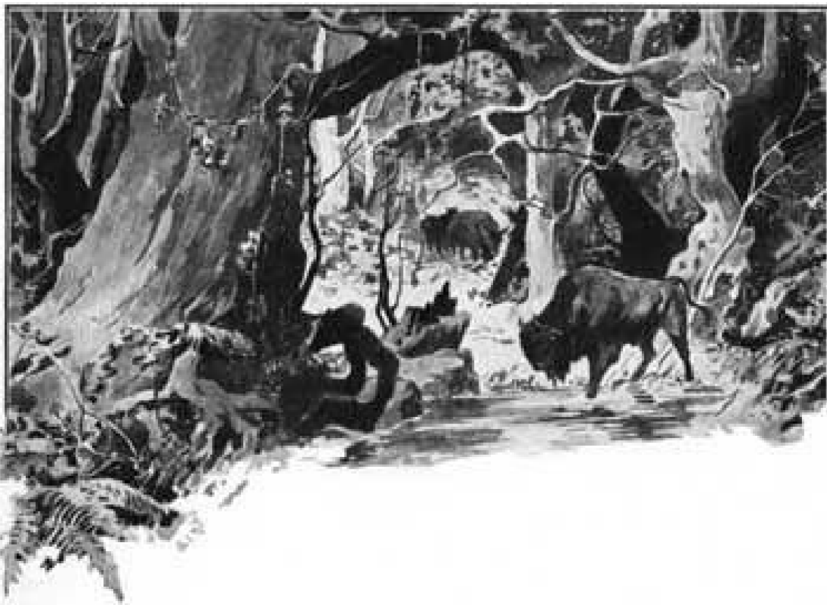
Хуучид өдрийг сэтгэн амуу би. 76 (77) т амалга.

Эрт цагийн домгийг айсан сонсмуу. Манай элэнц хуланц өвгөд дээдэс яахин манай нутгийн захад хүрч, Лаба Влтав зэрэг тэр нутгийн мөрөн гол дагуу оршин суусныг сонсмуу.